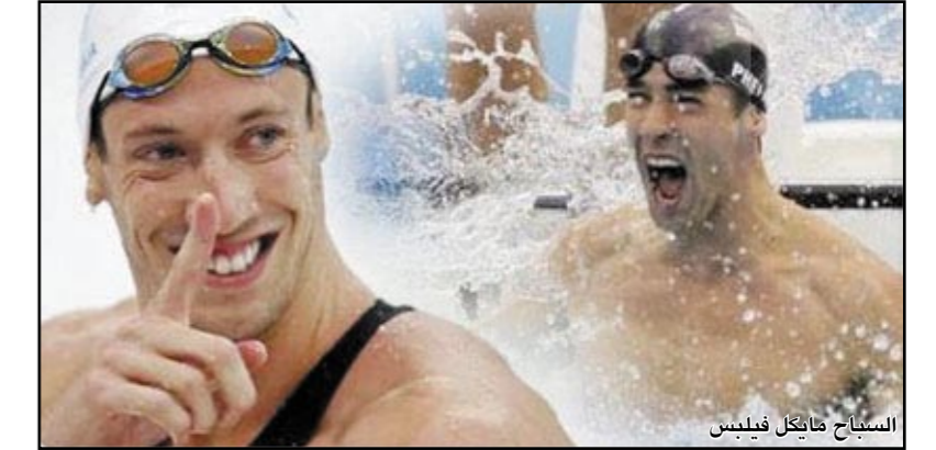
السباح مايكل فيلبس

أعلن السباح الأمريكي الأسطوري مايكل فيلبس أنه يفكر في منازلة الفرنسي آن برنار في سباق 100 متر حرة خلال بطولة العالم التي ستقام في تور/بوليو المقبل في روما، وذلك في حديث لصحيفة "غازيتا ديللو سبورت" الإيطالية يوم أمس الثلاثاء .. وكان فيلبس الحائز على 8 ميداليات ذهبية في بيكين حطم الرقم القياسي السابق في دورة واحدة لمواطنه السباح مارك سبيتز الذي أحرز 7 ذهيات في ميونيخ 1972، لكنه لم يشارك في سباق 100 م حرة الذي أحرزه الفرنسي برنار بوقت 47.21 ثانية .. وقال فيلبس الذي يمضي فترة راحة هو ومدربه بوب بومان: "لقد كنت قريباً جداً من رقم برنار، من الممكن أن تكون منازلة كبرى في روما، ورغم سعبي للوصول إلى أقصى الحدود إلا أن السباحة بعيدة جداً الآن عن تفكيري هذا السباق".