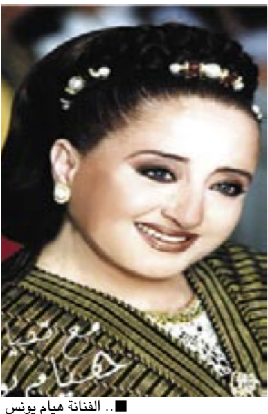
.. الفنانة هيام يونس

قالت الفنانة اللبنانية هيام يونس: أغادر اليمن وعندي أمل كبير أن أعود إلى هذه الديار العاصرة.